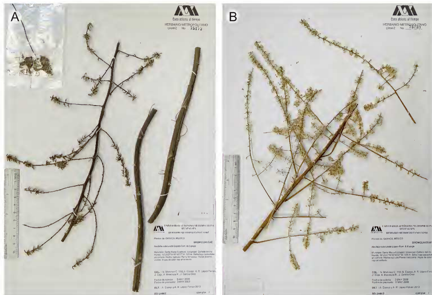
Fig. 4. A. Holotipo de Hechtia rubicunda López-Ferr. & Espejo; B. Paratipo de H. rubicunda López-Ferr. & Espejo.

R. y J. García-Cruz 115, planta masculina (IEB, MEXU, SERO, UAMIZ) (Fig. 4 B); cañada Tejón, río Otate, 16°14'15" N, 95°53'34" W, 850 m s.n.m., selva baja caducifolia, 9.V.1993, P. Tenorio L. 18866, planta femenina (MEXU).